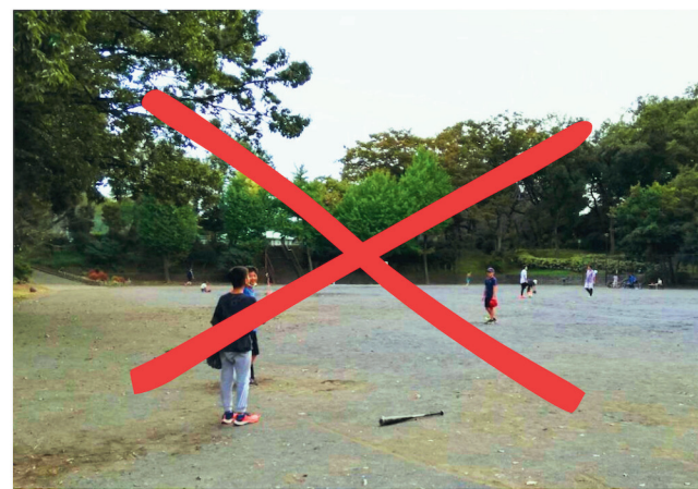
思いきりサッカーや野球ができる 貴重なスペース