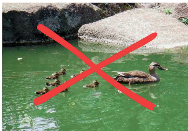
カルガモ、サギなどの野鳥も訪れる みんなに人気のスポット