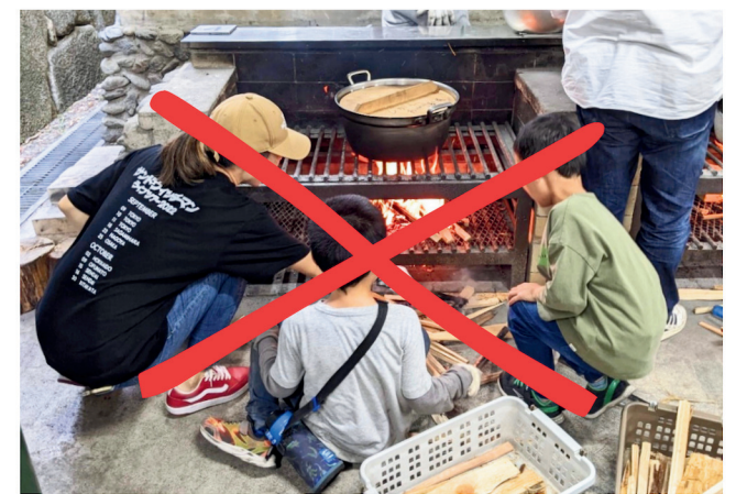
野外炊事や宿泊も体験できる 青少年のための施設