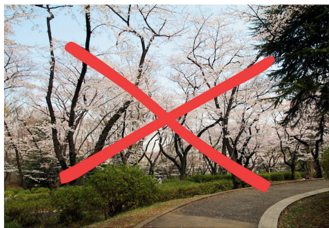
春は多くの方が桜を楽しむ名所